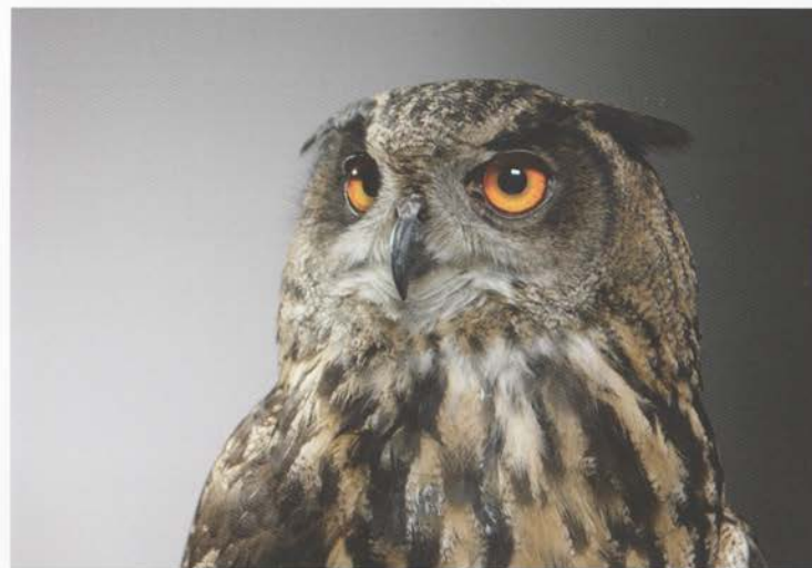
Konventionelles Display mit weißen LEDs TRILUMINOS™ Display

Auf intelligente Weise analysiert sie die dargestellte Szene, vergleicht sie mit einer riesigen, integrierten Bilddatenbank und verbessert daraufhin das Bild innerhalb von Nanosekunden, indem es Kanten glättet und Details verfeinert. So können Sie jedes einzelne Detail des Rückenfells eines Tigers erkennen und auch Ihre Hochzeits-Schnappschüsse werden glasklar dargestellt, selbst wenn Ihre Erinnerung daran etwas getrübt sein sollte. Ganz gleich was Sie betrachten, mit X-Reality PRO sehen Sie sehr viel mehr.